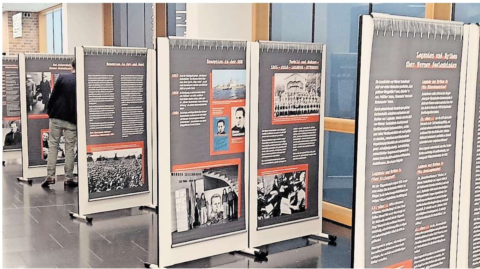
Eine Wanderausstellung im Gotischen Haus informiert über das Leben des Arbeitersportlers und Widerstandskämpfers Werner Seelenbinder.

Wust MOVIETOWN WUST Tel. 033 81/211 12 40, An der B1: Attack on Titan: The Last Attack 18.30 Uhr Captain America: Brave New World 16.45 Uhr Captain America: Brave New World 3D 19 Uhr Companion - Die Perfekte Begleitung 19 Uhr Flight Risk 17, 19 Uhr Mufasa: Der König der Löwen 16.45 Uhr Paddington in Peru 16.30 Uhr The Monkey 19.15 Uhr Vaiana 2 16.30 Uhr Wunderschöner 16.30, 19 Uhr