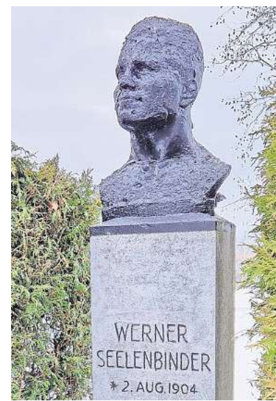
Das Seelenbinder-Denkmal auf dem Werner-Seelenbinder-Sportplatz.

und Widerstandskämpfers. So gibt es auch in Brandenburg an der Havel eine Werner-Seelenbinder-Straße und einen nach ihm benannten Sportplatz, wo bis heute ein Gedenkstein an ihn erinnert.